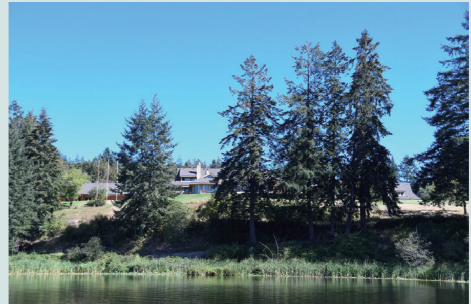
ホールデンレイクから臨むカナダナナイモ校地