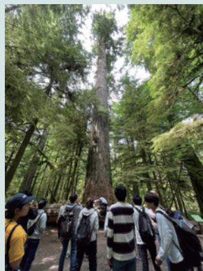
カナダMacMillan Park (Cathedral Grove)にそびえ立つ「Douglas-fir」