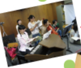
橋沢ゼミ オペラとその練習風景