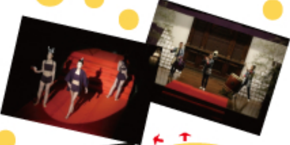
網野ゼミ Project WA! の発表の様子