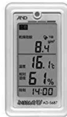
図-3 A&D社 (AD-5687)

これらWBGT計を複数用意し、各授業担当者が授業場所の計測を随時行う体制を取ることも必要であろう。活動開始時に水分摂取をすること、授業時間内でのこまめな給水などソフト面での予防策とともに、環境整備や観察の継続などハード面での予防に積極的に取り組んでいきたい。