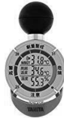
図-2 TANITA社 (TT562)

WBGT計は様々なタイプが市販されている(図-2, 3)。近年は安価なものも増え、スポーツ現場等で多く利用されている。