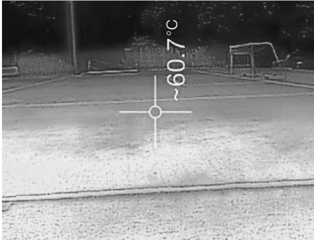
写真1 授業開始前 (C大学サッカー場)

影した写真である。上写真は11時の授業開始直前であり表面温度は60.7℃を示している。その後20分のウォーミングアップを終了した時点で62℃を記録した。短時間で表面温度は上昇し、同日授業終了時点では70℃まで上昇している。