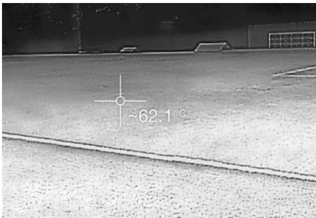
写真2 20分後 (C大学サッカー場)

人工芝グラウンドは、ゴムチップを使用していることやその色などにより高温になりやすい特性がある。