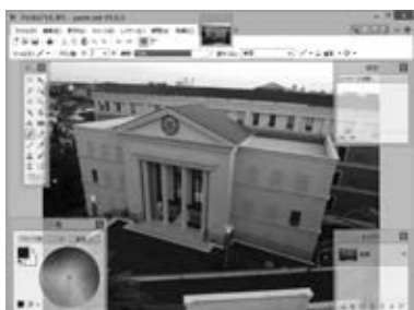
Paint.net を使用した編集画面