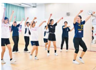
エアロビクチーム 中高大合同練習会