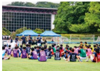
サッカー部 TAMAGAWA Family Soccer Event