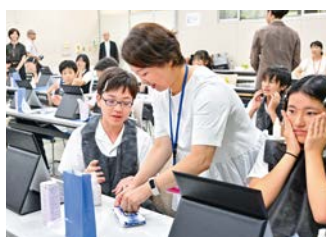
企業との共催企画 株式会社コーセー

玉川学園 6～8 年生の自由研究で「健康教育」を選択した生徒を対象に、株式会社コーセー・美容開発部によるレクチャーのもと、思春期のスキンケア方法を学びました。