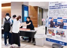
オープンキャンパス