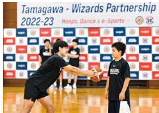
バスケットボール部 中高大合同サマーキャンプ