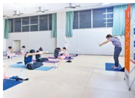
そのまま眠れるリラックスヨガ教室