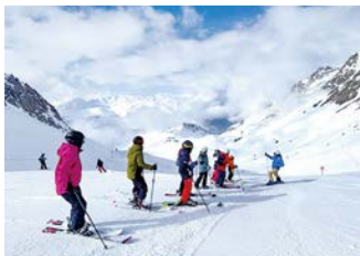
ファミリースキー in オーストリア 「本物に触れる教育」を実現